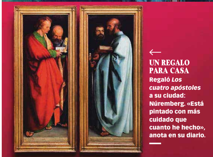
← UN REGALO PARA CASA Regaló Los cuatro apóstoles a su ciudad: Núremberg. «Está pintado con más cuidado que cuanto he hecho», anota en su diario.

perspectiva». Reapareció al fin en Núremberg en febrero de 1507, más convencido que nunca de su misión y colmado de admiración por los artistas italianos. Inmediatamente después de su regreso realiza los grandes desnudos de Adán y Eva del Museo del Prado, que demuestran su interés por las perfectas proporciones humanas, una obsesión recurrente en el artista.