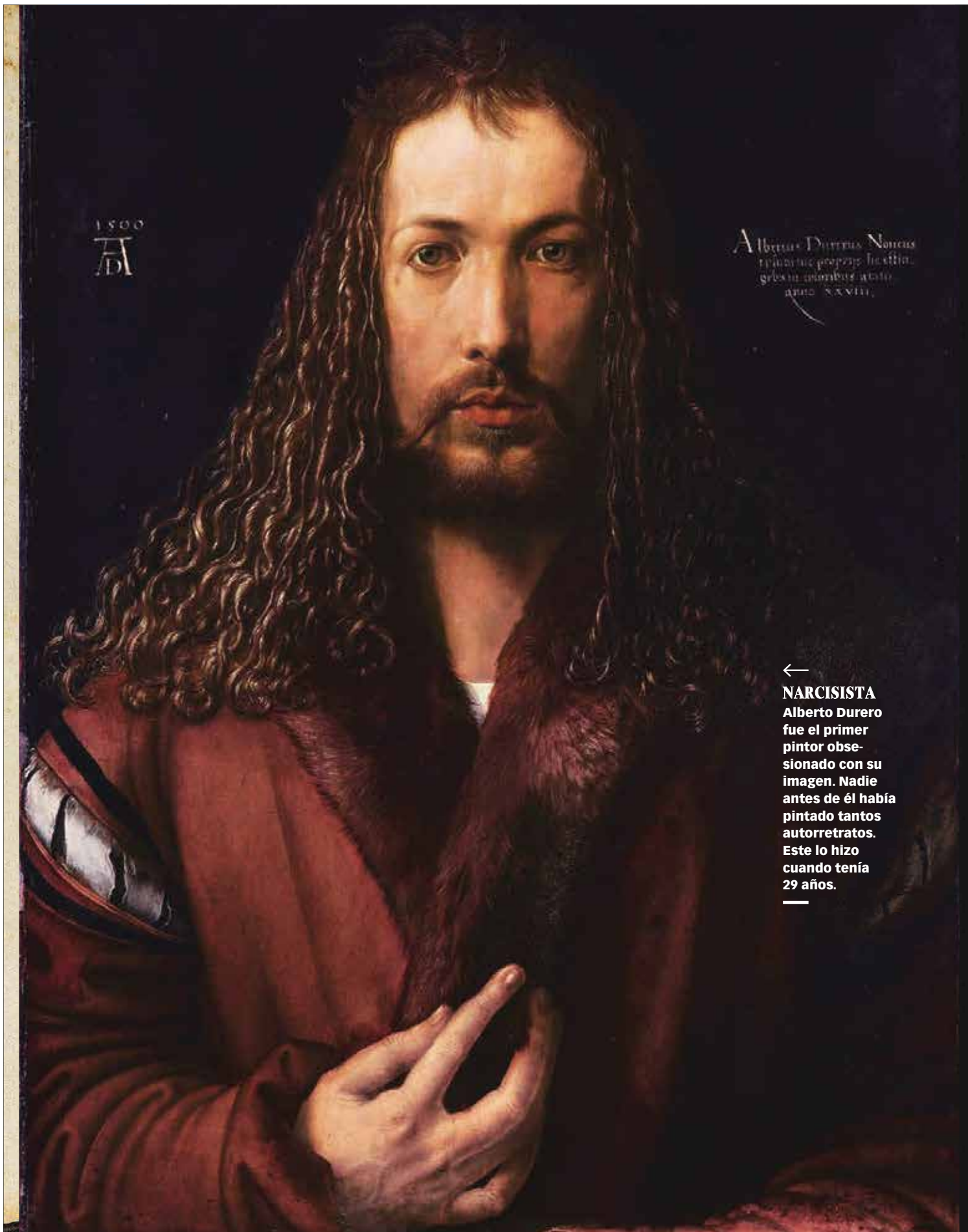
← NARCISISTA Alberto Dürero fue el primer pintor obsesionado con su imagen. Nadie antes de él había pintado tantos autorretratos. Este lo hizo cuando tenía 29 años.